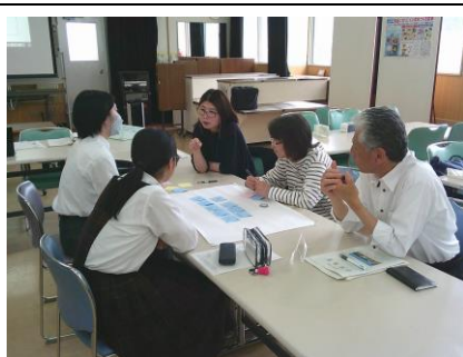
学校運営協議会での熟議