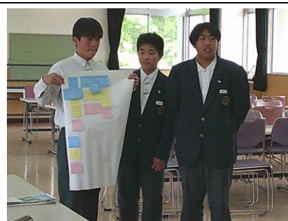
話し合ったことを発表

また、学校運営協議会では、生徒会執行委員の皆さんが協議会の大人の方たちと「明日も通いたいと思える学校」をテーマに熟議を行いました。たくさんの意見が出たので、地域の方にご協力をいただいて、一つずつ実現していきましょう。