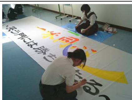
横断幕制作 (美術部)

当日だけではなく体育祭までの取組が、皆さんの今後の成長につながります。体育祭が終わった時、勝ち負けにこだわらず皆さんにとって良い思い出になるためには、お互いの声掛けや応援も大事です。全員でいい体育祭にしましょう。