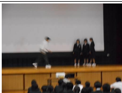
生徒会執行委員の劇

今年も佐伯中学校では、「いのちの大切さを考える全校集会」を行ったり、道徳の授業で「いのちの大切さを考える学習」をしたりすることとおして、「いじめは絶対に許されないこと」や「自分や他人の命を大切にすること」などについて、深く考えていきました。全校集会では、生徒会執行委員を中心に、日常のリアルな場面を寸劇で表現して注意を促したり、事前に実施したアンケート結果を基に、いじめのない佐伯中にしようと呼びかけたりしました。そして、生徒会執行委員が一人ずつ「いじめゼロ宣言」をおこなった後、全校生徒が「いじめゼロ宣言」を書いて、代表が全員に向けて発表しました。